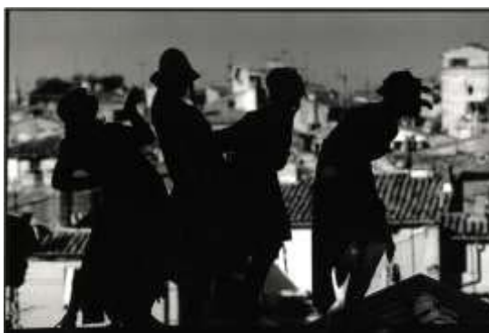
« Les laids », 1989