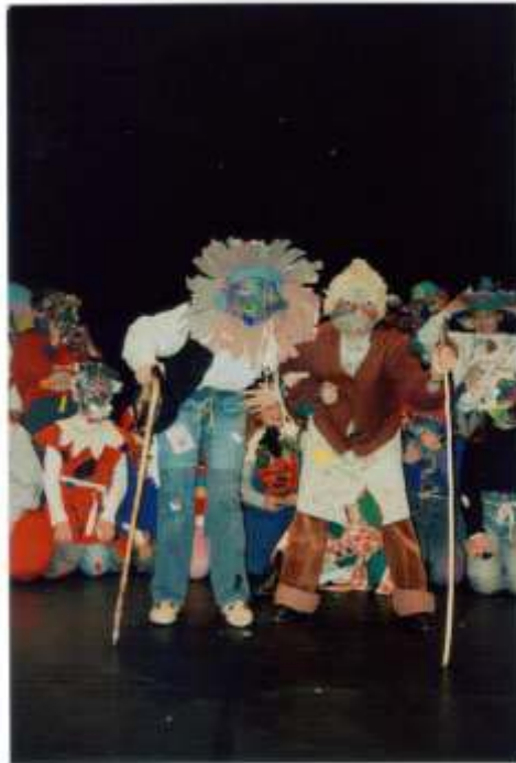
Des enfants déguisés en laids pour venir au spectacle