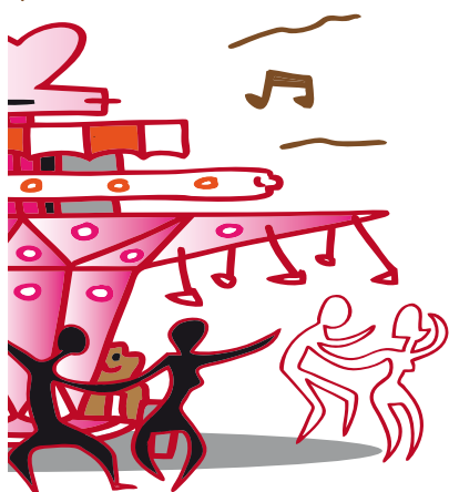
Tournez, tournez manège