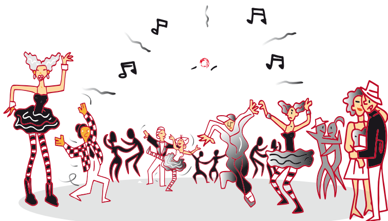
Oh ! un Bal !