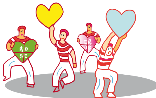
Des battements de coeurs