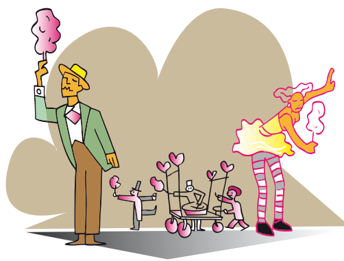
Les poupées mécaniques