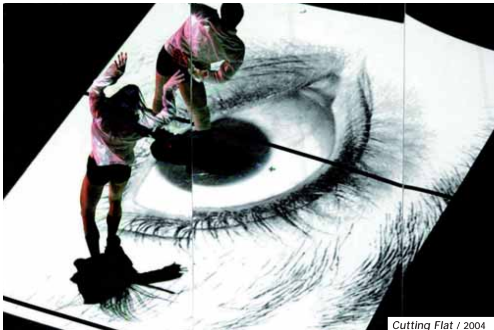
Cutting Flat / 2004

A.L. : Allegoria Stanza , une fusion de hip hop et de danse contemporaine. Créée à Suresnes en 2002, elle marque l’apothéose. Plus de 200 dates d’un coup, une pièce qui tourne encore aujourd’hui. Elle m’a fait connaître du grand public. Cutting Flat (2004). C’est mon premier contact avec Annecy qui va se solder par une collaboration fructueuse pendant 4 ans.