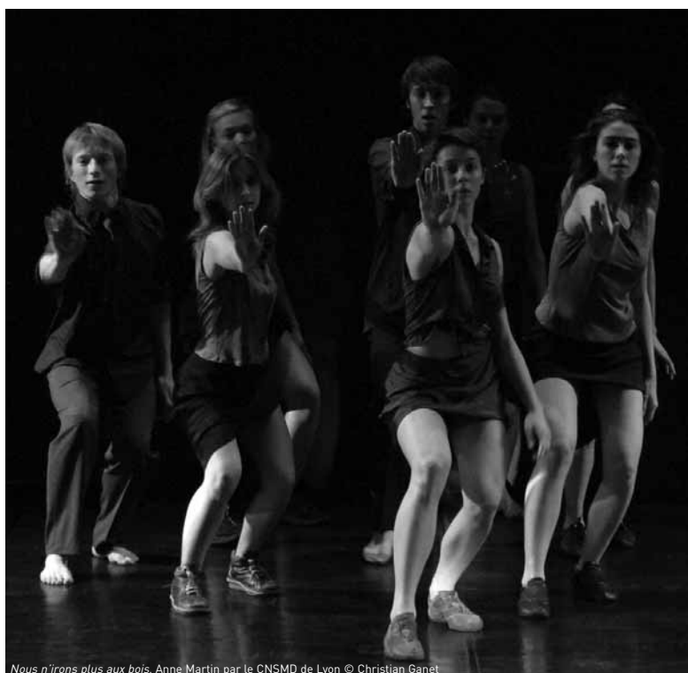
Nous n'irons plus aux bois , Anne Martin par le CNSMD de Lyon